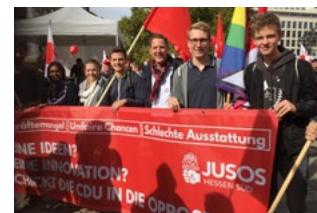
Mit dem Arbeitskreis Bildung der Jusos Hessen Süd